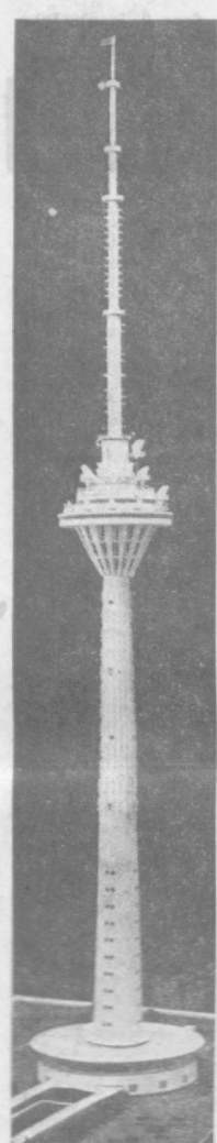
Эстонская ССР. В Таллине началось строительство новой радиотелевизионной передаточной станции...

Следующий номер газеты выходит завтра, 30 ноября.