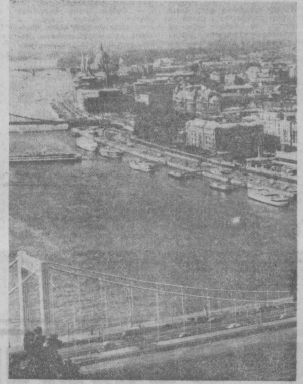
НА СНИМКЕ: СТОЛИЦА ВЕНГЕРСКОЙ НАРОДНОЙ РЕСПУБЛИКИ — БУДАПЕШТ.