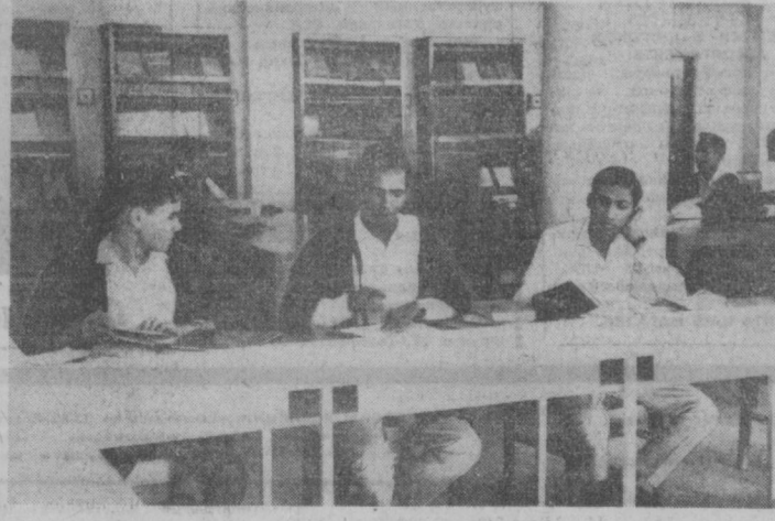
ПАКИСТАН. В БИБЛИОТЕКЕ КАРАЧИНСКОГО УНИВЕРСИТЕТА — ОДНОГО ИЗ КРУПНЕЙШИХ ВЫСШИХ УЧЕБНЫХ ЗАВЕДЕНИЙ СТРАНЫ.