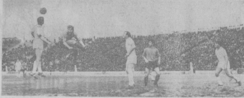
ИДЕТ БОРЬБА В ШТРАФНОЙ...