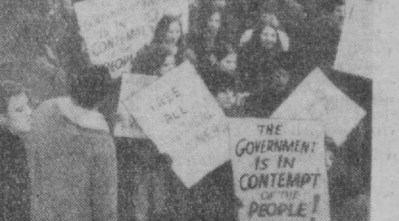
НЬЮ-ЙОРК. Несколько тысяч жителей крупнейшего города США приняли участие в демонстрации протеста против позорного судебного приговора, вынесенного чикагским федеральным судом группе активистов американского антивоенного движения. Демонстранты скандировали лозунги и разбрасывали листовки с требованием отменить несправедливый приговор, вынесенный чикагским судом на основе сфабрикованных «обвинений».

Телефон Л. Пахомовой.