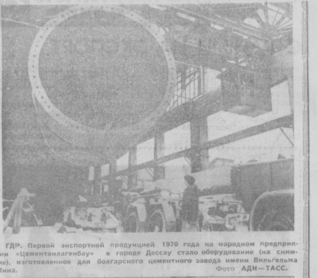
ГДР. Первая экспортная продукция 1970 года на народном предприятии «Цементалленбау» в городе Дессау стало оборудование (на снимке), изготовленное для болгарского цементного завода имени Вильгельма Пика.

КРАКОВ. В Новой Гуте, молодом пригороде Кракова, будет воздвигнут монументальный памятник В. И. Ленину. Его закладка состоится 22 апреля, в союзу годовщину со дня рождения вожды мирового пролетариата. В творческом конкурсе по разработке лучшего проекта памятника приняло участие около 200 польских скульпторов и архитекторов. Представленные ими работы в ближайшие дни будут демонстрироваться на специальной выставке в Кракове.