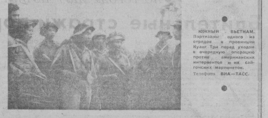
ЮЖНЫЙ ВЬЕТНАМ. Партизаны одного из отрядов в провинции Куанг Три перед уходом в очередную операцию против американских интервентов и их слугонских марionетов.

2 Исследования Ташкент. 14 марта 1970 г.