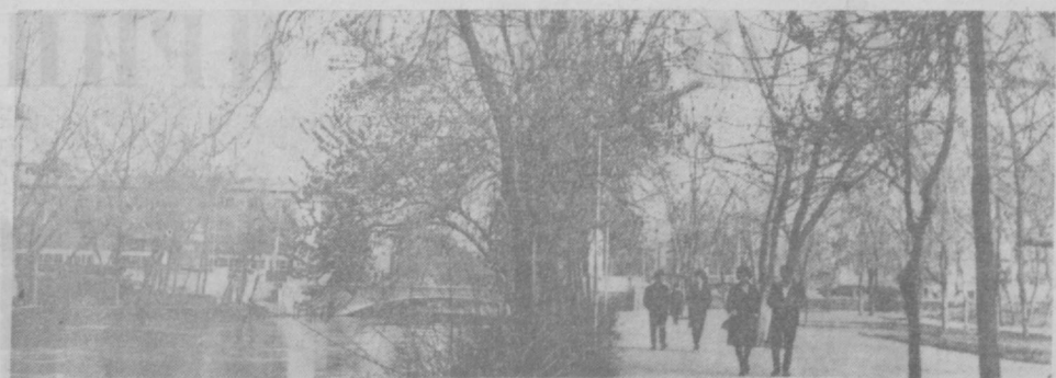
В БУДАПЕШТЕ пришла в наш город вместе с первыми фиалками, которые мы дарили любимым, вместе с альмами гвоздиками и нежными нарциссами. Она пришла и разбросала по городу

— Это великолепно, это я должна петь сама! В ближайшем рею Королевского театра для моей песни была специально написана декорация. Федаки сделала забавную, необычайно смешную маску, вышла на сцену с собственной собачкой, и публика каждый вечер встречала ее и старую таксу по кличке Буберль бурными аплодисментами.