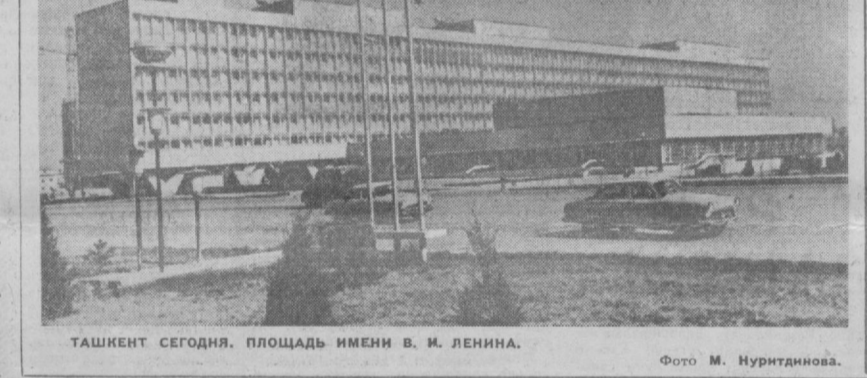
ТАШКЕНТ СЕГОДНЯ. ПЛОЩАДЬ ИМЕНИ В. И. ЛЕНИНА.

Недавно районный комитет партии рассмотрел вопрос об оказании шефской помощи совхозам Пахтакорского района во время весенне-полевых работ. Коллективы ведущих предприятий района: авиационного завода имени Чкалова, «Ташсельмаша», Куйлюкского ремонтно-механического завода, строительного треста № 3, домостроительного комбината № 1 и других комплектуют бригады слесарей для оказания помощи труженикам целины в ремонте техники, го-