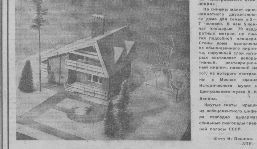
На снимке: макет однокомнатного двухэтажного дома для семьи в 5—7 человек. В нем 5 комнат площадью 70 квадратных метров, не считая подсобной площади. Стены дома выложены из обыкновенного кирпича, наружный слой которых составляет декоративный, реставрационный кирпич, похожий на тот, из которого построены в Москве здания Исторического музея и Центрального музея В. И. Ленина. Крутые скаты крыши из асбестоцементного шифера свободно выдержат обильные снегопады средней полосы СССР.

12—14 квадратных метров. Здесь же, в зоне спален, расположена ванная комната, а санузел — в прихожей. Отопляет квартиру выбранный в соответствии с ее объемом один из пяти типов удобных и экономичных отопительных колонок ОГВ, уже прекрасно зарекомендовавших себя в роли «центрального отопления».