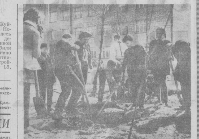
«Превратим наш школьный двор в зеленую зону» — так решили учащиеся школы № 225. После уроков они активно участвуют в озеленении территории, разбивают клумбы. На снимке: учащиеся 5 класса за посадкой саженцев деревьев.

Большое внимание уделяется озеленению новых жилых кварталов на массивах Куйлюк-1 и Куйлюк-2. Новоселы посадили здесь около двух тысяч деревьев, много живой изгороди, разбили цветники. Активно участвуют в субботниках строители, строуправлений №№ 15, 23 и 24.