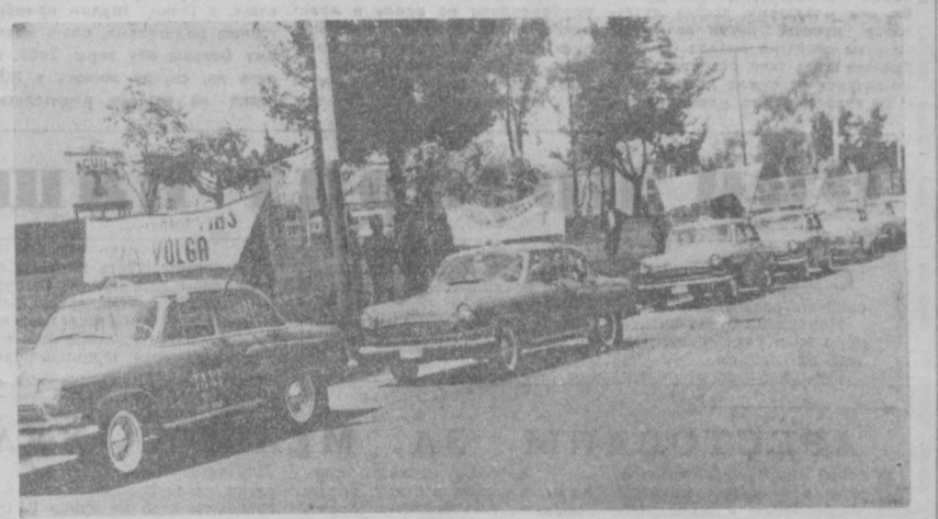
БОГОТА. Недавно жители колумбийской столицы наблюдали необычную картину. Длинная колонна автомашин советской марки «Волга», медленно двигалась по центральным улицам города, гудками привлекая внимание прохожих к плакатам с надписями: «Нам нужно больше такси «Волга», «Мы удовлетворены качеством машин «Волга», «Машин «Волга» имеет мировую известность». Так водители этого вида городского транспорта выразили свой протест против закупаемых властями отдельных фирм американских автомобилей-такси. Советская машина «Волга» пользуется доброй славой у колумбийских автомобилистов. Они отмечают в ней большую выносливость, высокую проходимость и экономичность. НА СНИМКЕ: колонна машин «Волга» на одной из улиц Боготы.

В СУЭЦЕ П ОЛОЖЕНИЕ на Ближнем Востоке в результате израильской агрессии продолжает оставаться напряженным. Не угасают бои и в зоне Суэцкого канала, которую теперь египтяне называют «восточным фронтом». Сейчас в Суэце осталось не более 10 тысяч жителей из 250 тысяч, проживавших до войны. Целые кварталы полностью разрушены или сильно повреждены жилых зданий, полуразрушены школы, больницы, кинотеатры, мечети, груды битого кирпича, камня и стекла, многочисленные траншеи, противотанковые «ежи», заграждения