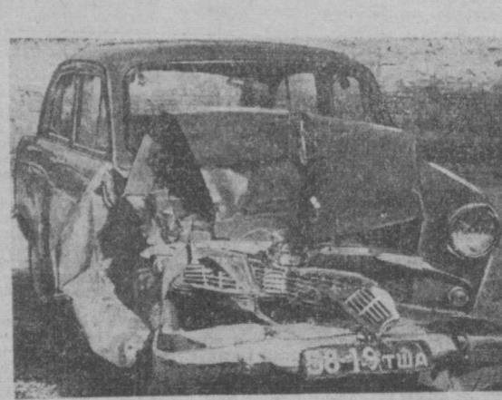
НА СНИМКЕ: разбитый «Москвич» 58-19 ТША.