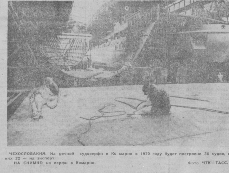
ЧЕХОСЛОВАКИЯ. На речной судостроительной верфи в Ко марно в 1970 году будет построено 36 судов, из них 22 — на экспорт. НА СНИМКЕ: на верфи в Ко марно.

НОВЫЕ АВТОМОБИЛИ В АРИШАВА. Быстрейшей темпкой развивается польская автомобильная промышленность. Новые автобусы «Ниса» и «Сано», новая грузовая автомашинка «Ельч-316» появятся на польских дорогах в этом году. Грузоподъемность «Ельч-316», производство которого освоено на автомобильном заводе в Ельче близ Вроцлава, составляет 10 тонн, скорость — до 80 км. в час.