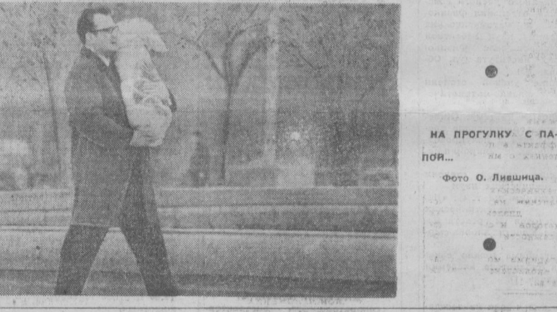
НА ПРОГУЛКУ С ПЛ...