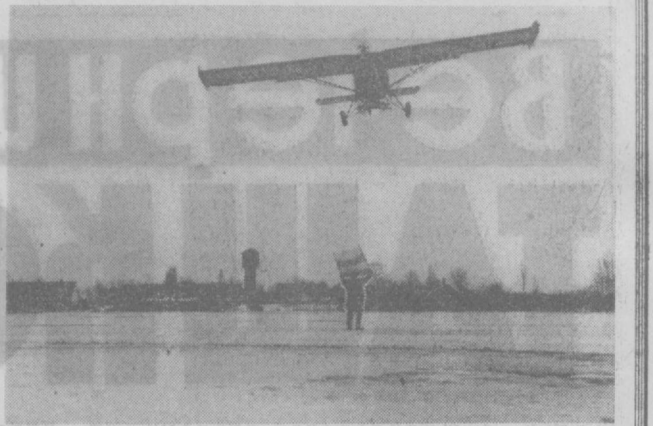
Рекордный для страны урожай зерновых был получен в Венгрии в прошлом году. Сейчас земледельцы, готовящиеся к весенним полевым работам, закладывают основы будущего — еще более высокого урожая. Народнохозяйственный план 1970 года предусматривает повышение сельскохозяйственного производства на один процент. НА СНИМКЕ: Шольтинский госхоз. Самолет сельскохозяйственной авиации удобряет землю.

М. ЦЕПАНЬСКИЙ, главный редактор газеты «Трибуна работница».