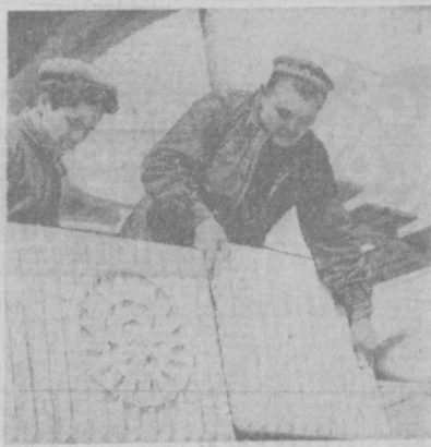
На бульваре имени В. И. Ленина подходит к концу строительство павильона по продаже прохладительных напитков.

Сев пшеницы и ячменя закончен в долинах Узбекистана. Яровые культуры заняли 145 тысяч гектаров. Сев зерновых переместился в предгорные зоны с трудным рельефом. Сюда и направлена теплотехника. Уже справились с весенним заданием земледельцы одной из главных зерносеющих областей — Кашкардинской. Накануне выполнения плана Сырдарьинской области. Одновременно с севом ячменя ведут уход за озимыми культурами, которые занимают 850 тысяч гектаров. Пока на одних участках идет боронование