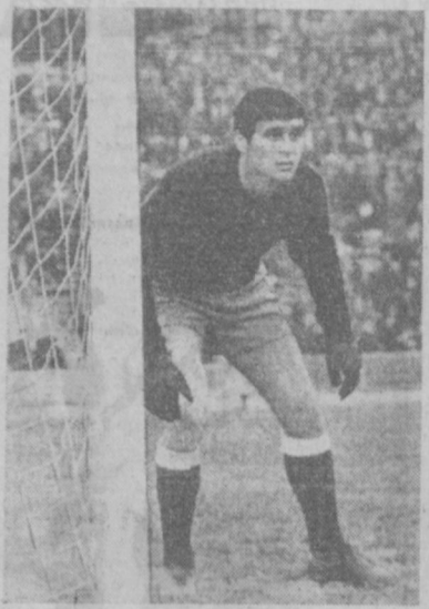
Всегда начеку...