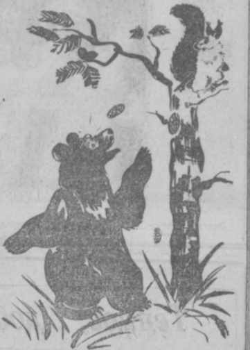
Рис. З. Мартыновой.