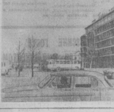
ТАШКЕНТ СЕГОДНЯ. ГОСТИНИЦА «КОСМОС».

Нельзя забывать, что за каждым письмом — человек, его тревоги, заботы и не только о себе, но и об общественном благе, благе всего нашего общества.