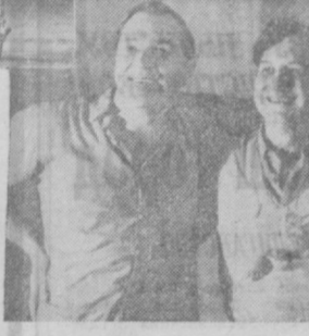
НА СНИМКЕ: сцена из спектакля.

Сегодня, в Международный день театра, на советских сценах пойдут самые значительные спектакли наших дней. Зрители встретятся с любимыми артистами, режиссерами, балетмейстерами. Лучшие свои работы покажут любительские коллективы. Прогрессивные театральные деятели мира раз в году на всех языках вместе славят искусство театра. В этом содружестве выразительно и ярко звучит голос многонационального советского искусства. (ТАСС).