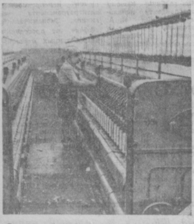
Текстильный комбинат оснащается новой техникой и оборудованием. Все это способствует улучшению качества выпускаемой продукции, повышению производительности труда.