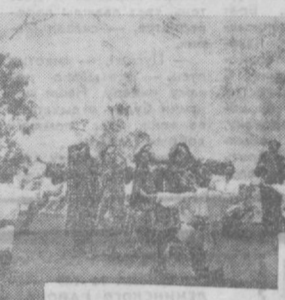
Ансамбль Узбекской Государственной филармонии «Шоддин» — один из самых молодых в республике. Не он уже успел завоевать популярность. Артисты ансамбля с успехом выступают на сценах дворцов культуры, заводских и совхозов, они много гастролируют.

На сцене Узбекского Государственного академического театра драмы имени Хамзы с большим успехом идет трагедия «Мария Стюарт» Ф. Шиллера.