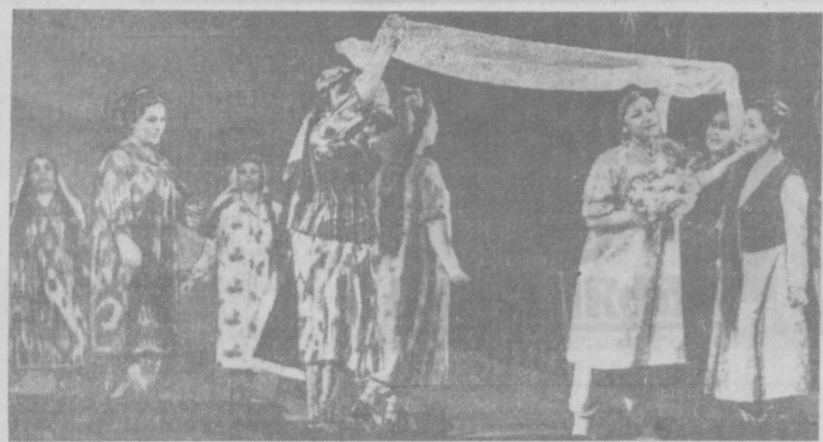
Опера И. Хамраева «Ойджамол», недавно поставленная на сцене Государственного академического Большого театра УзССР имени Навои, рассказывает о счастливой судьбе женщины-узбечки советского Узбекистана. НА СНИМКЕ: сцена из спектакля.