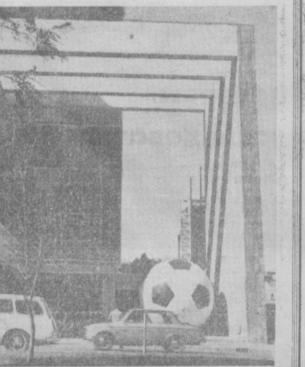
МЭКСИКА. У одного из столичных зданий на улице Реформа организаторы будущего чемпионата мира по футболу установили гигантский футбольный мяч. Он напоминает прохожим, что до первого матча первенства остается меньше и меньше дней. 31 мая этого года начнутся международные баталии лучших мастеров футбола на кубок Юлуса Рима.

СОФИЯ. На судовой верфи имени Георгия ДIMITрова в Варне спущено на воду нефтеналивное судно «Волгопетель» водоизмещением в 5.000 тонн, предназначенное для Советского Союза.