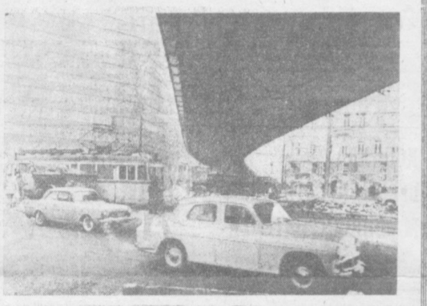
БУДАПЕШТ, ПЛОЩАДЬ БАРОШША (У ВОСТОЧНОГО ВОКЗАЛА).

Ференц ЗАГОНИ, венгерский журналист. (АПН — «Будапресс»), Будапешт.