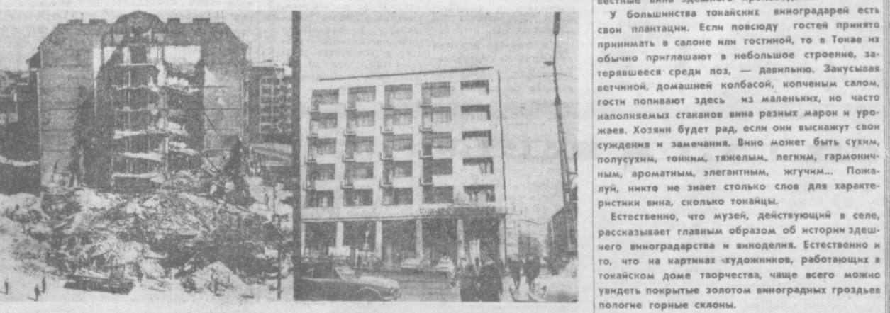
На 25 лет, прошедших со дня освобождения Венгрии от фашистских захватчиков, была полностью восстановлена столица Венгерской Народной Республики — город Будапешт. НА СНИМКЕ: уголь проспекта Мучеников и улицы Кароля Келети в Будапеште — в начале 1945 года, справа — в начале 1970 года.

Ученый интервал, дает схему генетической классификации бокситовых месторождений Средней Азии. Рудопроизводство много, в каждом со своими геологическими особенностями, и, несмотря на это, он приходит к выводу, что среденаязическое и нижнеазиатские бокситы имеют морское происхождение. Они накапливались в предкембрийское и предкарибское время в