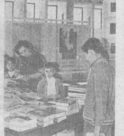
В одном из крупнейших городов Мексикки — Гвадалахаре проходила Неделя советской культуры, посвященная 100-летию со дня рождения В. И. Ленина.