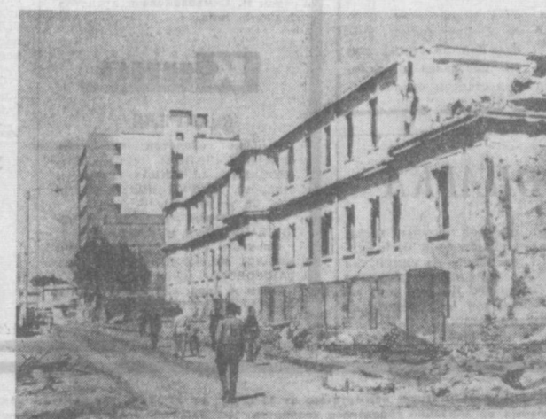
Израильская военщина продолжает агрессивные действия в отношении арабских стран. Недавно израильская авиация совершила новое кровавое преступление. Два израильских «Фантома» подвергли авиаразрывом бомбардировочный завод в Абу-Заабале в 15 километрах от Каира, применив напалм и бомбы замедленного действия. Убито около 80 человек, более 100 раненых доставлено в госпиталь Ханки. Этот небольшой городок близ Каира также пострадал от налета «Фантонов».

Л ОНДОН. «Мы жестоки к престарелым — может быть, более жестоки, чем кто-либо в другой стране Западной Европы», — пишет «Ньюс об уорлд». Газета публикует материалы об условиях жизни пенсионеров. «Более двух с половиной миллионов английских пенсионеров впадают жалкое существование в условиях постоянной нищеты и хронического недоедания», — констатирует газета. Тысячи пенсионеров, указывает далее газета, вынуждены жить в переполненных домах для престарелых, не надеясь получить сносное жилище. 372 тысячи пенсионеров живут в домах, лишенных самых элементарных коммунальных удобств. Если бы наше общество предстало перед судом за свое отношение к престарелым, то оно вынуждено было бы признать себя виновным.