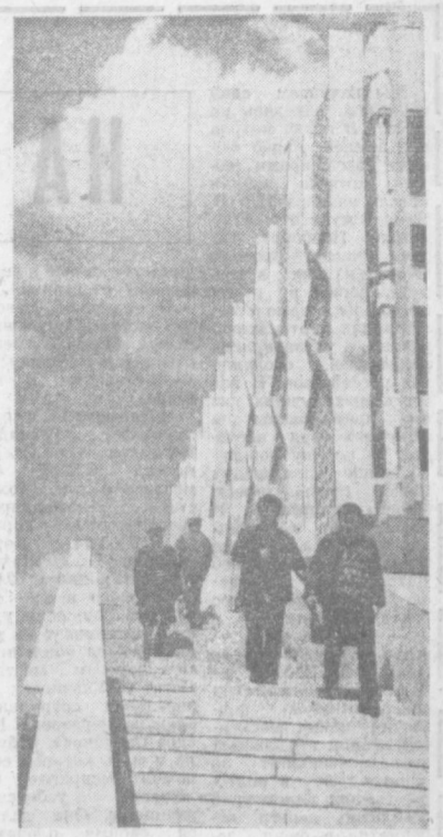
У филиала Музея В. И. Ленина.