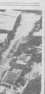
НА СНИМКЕ: в танках хищники ищут три четверти населения острова.

НЬЮ-Йорк. Коррупция и мошенничество стали непеременимыми атрибутами американской действительности, вставив корни даже в судебную систему. В судебных кругах г. Филадельфия (штат Пенсильвания) разгорелся скандал. В контрабанде и мошенничестве и уклонении от уплаты налогов был обвинен судья апелляционного су-