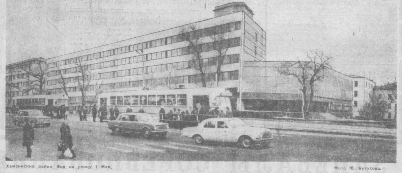
Хамзинский район. Вид на улицу 1 Мая.