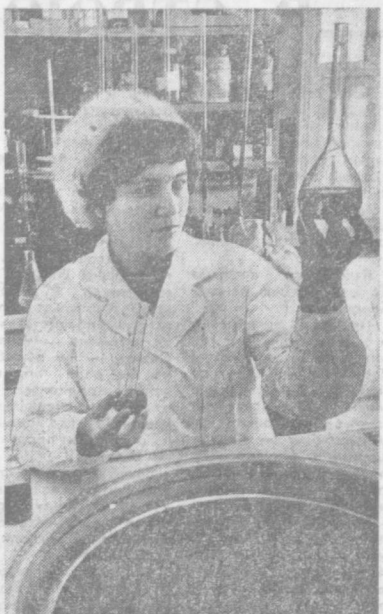
Большую исследовательскую работу по изучению зерновых и технических культур ведет Среднеазиатская опытная станция Всесоюзного института растениеводства.