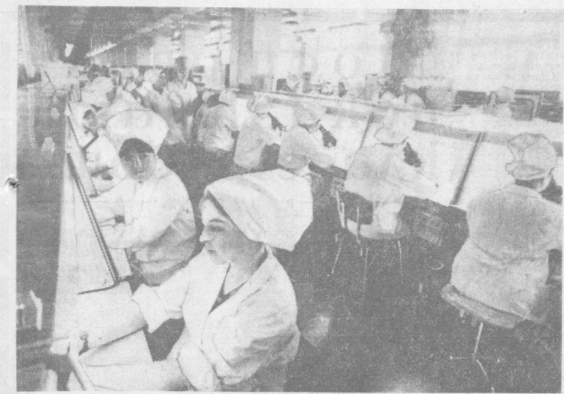
Тысячи рабочих ордена Ленина завода электронной техники имени В. И. Ленина включились в социалистическое соревнование по достижению встречи XXV съезда КПСС. За право называться цехом, сменой или бригадой имени XXV съезда КПСС ведут борьбу почти все производственные коллективы этого предприятия.