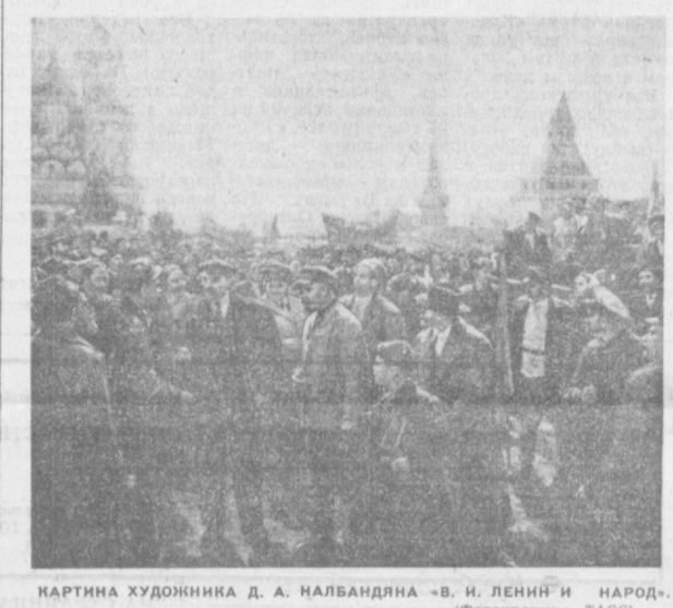
КАРТИНА ХУДОЖНИКА Д. А. НАЛБАНДЯНА «В. И. ЛЕНИН И НАРОД».