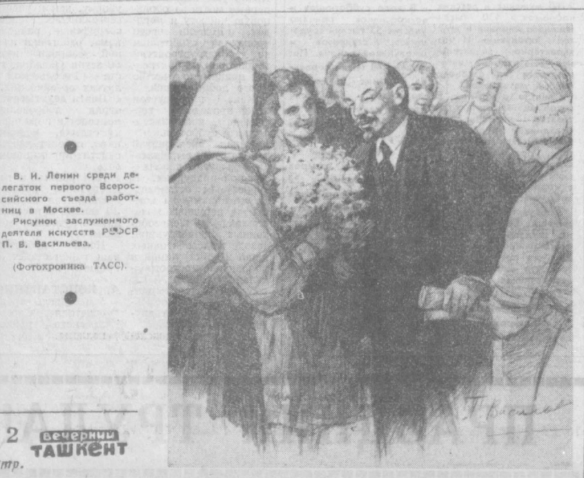
В. И. Ленин среди делегатов первого Всероссийского съезда рабочих в Москве. Рисунок заслуженного деятеля искусств РСФСР П. В. Васильева.