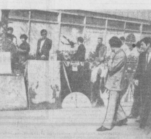
ТОКИО. Выставка произведений, в которых выражены протест против агрессии США во Вьетнаме, на центральной улице японской столицы Гиндза. Такие выставки устраиваются по воле страны.

ные власти сообщили, что суд над Коли, возглавлявшим «операцию» по уничтожению детей, женщин и стариков в Сонгми в 1968 году, переносится на середину лета. Коли предъявлено обвинение в убийстве 102