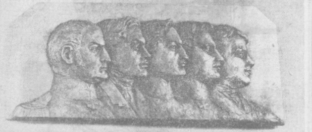
Декабристы, которые были приговорены к смертной казни: П. И. Пестель, С. И. Муравьев-Апостол, М. П. Бестужев-Рюмин, П. Г. Каховский и К. Ф. Рылев (барельеф из Музея истории и реконструкции Москвы).

судьба после разгрома восстания, влияние идей «подвижников свободы» на развитие революционно-го движения на Украине. Вскоре эта документальная выставка, посвященная годовщине восстания. Большой интерес вызывает новый документ, рассказывающий о судьбе солдата мятежного Черниговского полка. По записям, сделанным в маршрутном листе, сотрудницы Центрального государственного исторического архива УССР потрудились восстановить путь следования сыновья солдата, отправленного «адарской милостью» в действующую армию на Кавказ. Киев. (Корр. ТАСС).