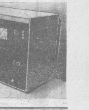
НА СНИМКЕ: первый промышленный образец «Телефота».

Как будет проходить в новом году военно-патриотическая тема?