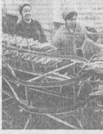
На обувной фабрике № 2 аступил в строй новый конвейер по пошиву модальной женской обуви. Он позволяет избавиться от многих трудоемких процессов, производимых ранее вручную. НА СНИМКЕ: один из участков конвейера.