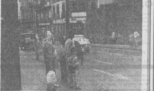
КАНАРСКИЕ ОСТРОВА. На улицах крупного портового города Лас-Пальмаса.