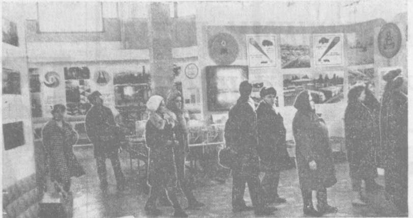
ВДНХ УзССР. Горняки и гости столицы с интересом знакомятся с новой экспозицией отдела, где представлены образцы промышленной продукции республики.

А. КАШАПОВ, корреспондент газеты «Ударник» Ташкентского авиационного производства.