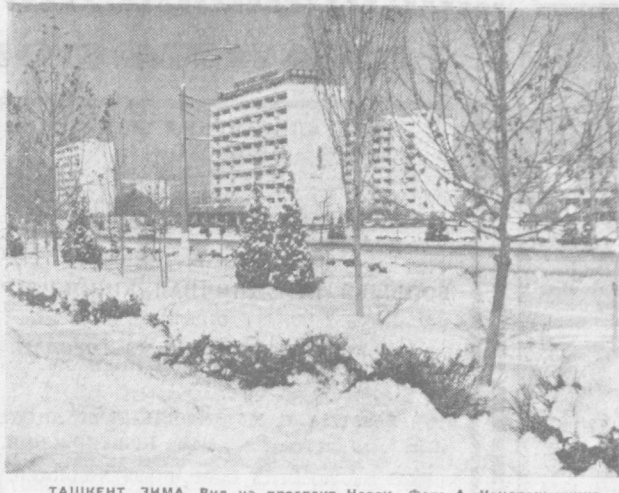
ТАШКЕНТ. ЗИМА. Вид на проспект Навои.

Ну где же елка? Кто принесет ее ребятам? И тут, будто по мановению волшебной палочки, лесная красавица на глазах у зрителей засверкала огнями. Начинается праздничное представление. В нем принимают участие артисты коллектива «Цирк на сцене». Где только не побывают ребята за два часа представления. Они встретятся с сильными жонглерами, иллюзионистом, дрессированными медведями, коверными, прыгучими в поющих герцах сказок, вместе с Дедом Морозом и Снегурочкой посетят новогоднее царство.