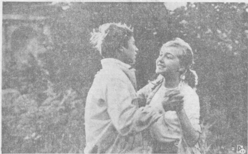
Авторы сценария: Александр АЛЕКСАНДРОВ, Сергей СОЛОВЬЕВ. Режиссер-постановщик: Сергей СОЛОВЬЕВ. ПРОИЗВОДСТВО КИНОСТУДИИ «МОСФИЛЬМ». ФИЛЬМ РАССКАЗЫВАЕТ О ПЕРВОЙ ЛЮБВИ, О ТОМ ВОЗРАСТЕ, КОГДА ПОДРОСТОК НАЧИНАЕТ ПОЗНАВАТЬ САМОГО СЕБЯ.