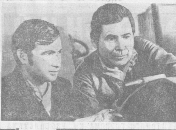
Часть документов публикуется впервые.

В издательстве политической литературы вышел в свет сборник «В. И. Ленин, КПСС о работе партийного и государственного аппарата». В книге три раздела: «В. И. Ленин о партийном и государственном аппарате», «КПСС о принципах работы, структуре и кадрах партийного и государственного аппарата», «КПСС об улучшении работы партийного и государственного аппарата».