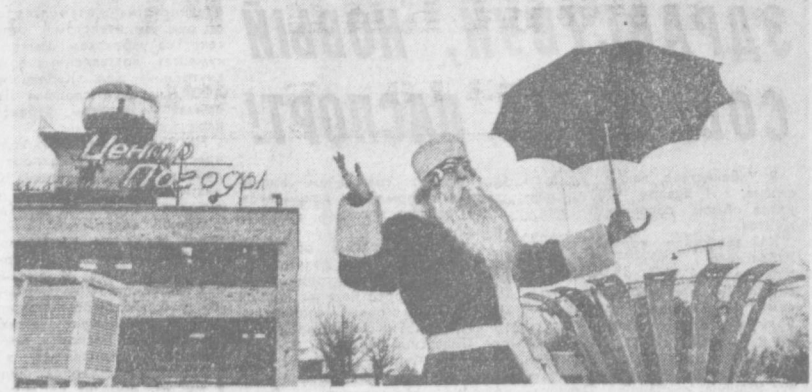
В Ленинграде посылал Дед Мороз. Волшебный спутник новогодних праздников совершает путешествие по городу на Неве.

В заключение остается сказать, что Ташкентский педагогический институт 40 лет назад на базе педагогического факультета государственного университета имени Ленина, сам уже дал жизнь четырем институтам: в 1948 г. — институту иностранных языков; в 1961 г. — институту физической культуры и спорта; в 1963 г. — Республиканскому институту русского языка и литературы; в 1974 г. — Республиканскому институту культуры.