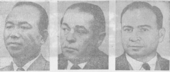
На снимках сверху вниз — Людвиг Свобода, Лайнус Полинг, Шафи Ахмед эль-Шейх и Ярослав Ивашевич; внизу слева направо — Акира Исаи, Бертиль Сванстрем и Халеуд Мохи эд-Дин.