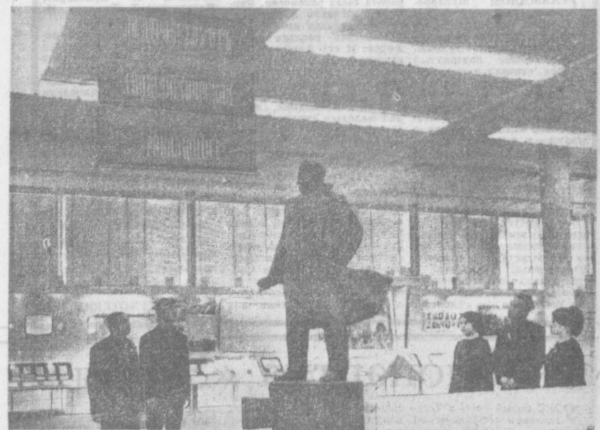
В филиале Музея Владимира Ильича Ленина.