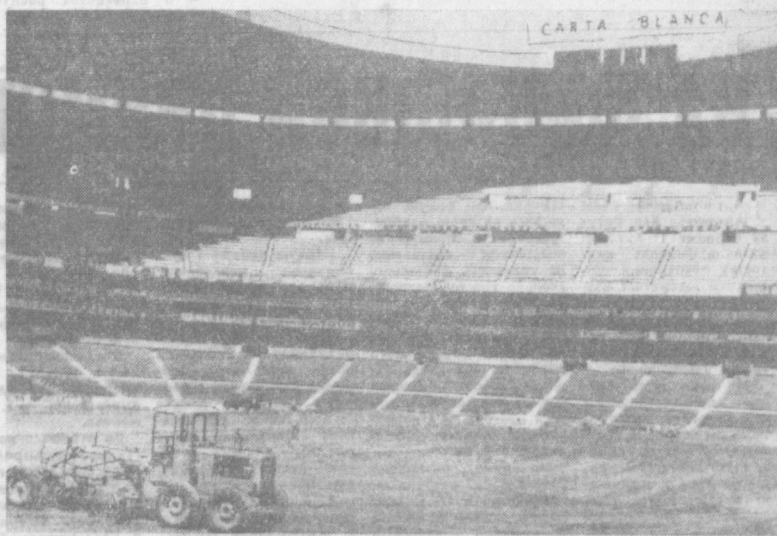
Стадион «Ацтена» в Мехико наводит лес, перед тем, как принять сильнейших футболистов планеты. С футбольного поля сняли старый зеленый ковер и настлают новый. Ровно, кубки и кубики, укладывают мексиканские рабочие поле стадиона специально выращенной зеленой травой. Скорь работы будут закончены. Затем траву подорвут удобрениями, укают, и обновленный «Ацтена» будет ждать гостей. НА СНИМКЕ: с каждым часом ширится фронт работ.