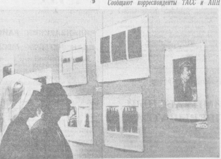
В центре Кувейта, в средней школе Мубаркия открыта выставка советской графики, организованная в соответствии с соглашением о культурном сотрудничестве между двумя странами. Работы советских художников знакомят кувейтцев с различными сторонами жизни нашей страны. Видное место на выставке занимает ленинская тематика.