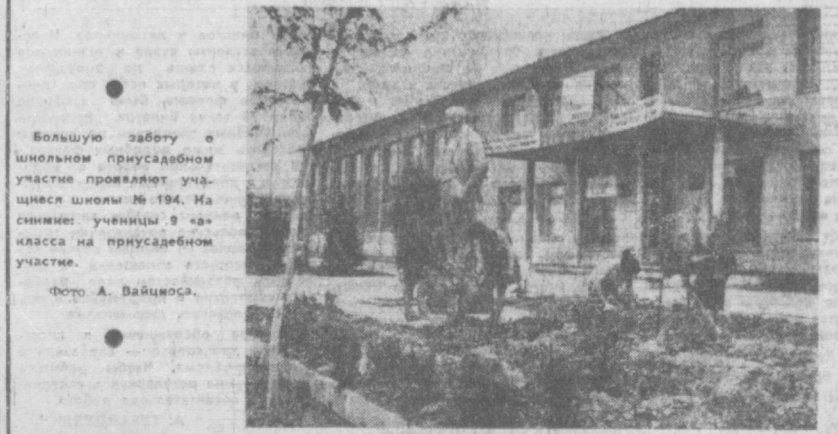
Большую работу о школьном приусадебном участке проявляют учащиеся школы № 194. На снимке: ученицы 9-го класса на приусадебном участке.