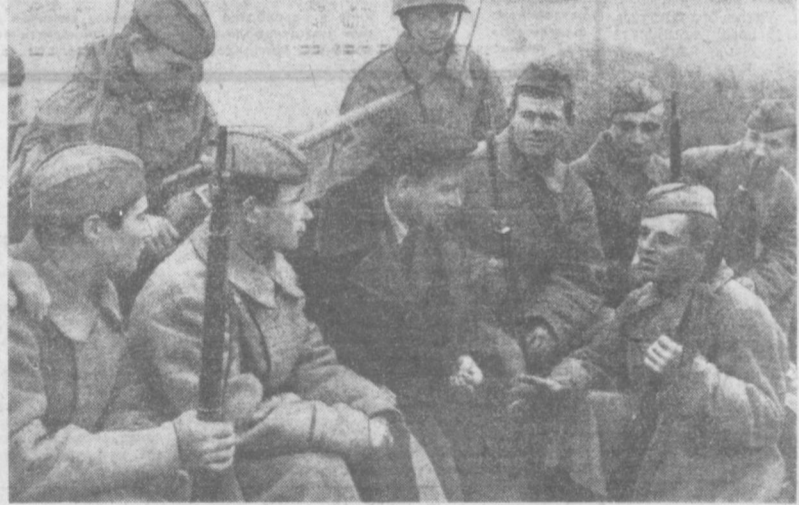
1942 год. СЕВЕРО-ЗАПАДНЕЕ СТАЛИНГРАДА. БАШКИРСКИЙ ПИСАТЕЛЬ Б. БИКБАЕВ В ГОСТЯХ У ВОИНОВ.