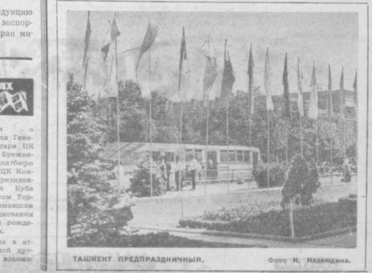
ТАШКЕНТ ПРЕДПРАЗДНИЧНЫЙ.

Более миллиона метров тканей только в этом году изготовил коллектив Ташкентского текстильного комбината по заказу друзей из-за рубежа.