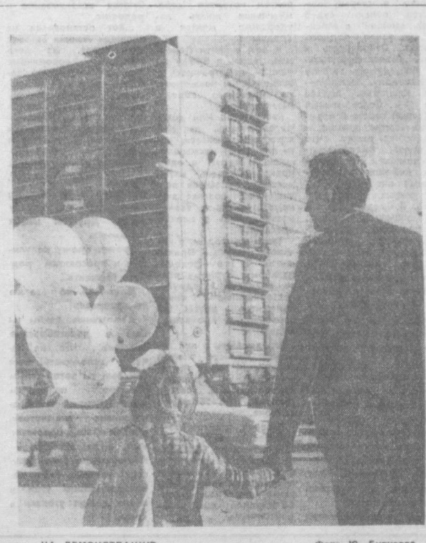
НА ДЕМОНСТРАЦИЮ.

ВА новостройки Болгарии из Ташкента отправлена первая в нынешнем году колесная передвижная компрессорная станция. Поставка этих машин начата заводом «Компрессор» с опережением графика. В адрес Болгарии предприятие отгрузит в 1970 году двадцать четыре компрессорных станции. — Восемнадцать лет назад завод впервые вышел на мировой рынок, — сказал заместитель главного инженера Т. Г. Гринберг. — С тех пор зарубежные фирмы 39-ти государств закупили у нас свыше тысячи передвижных компрессорных станций. Только с начала пятилетия их поставка на экспорт увеличилась в три раза. За восемь предыдущих лет мы не получили от иностранных покупателей ни одной рекламации. С будущего года предприятие предполагает приступить к поставке за рубеж новых, более совершенных компрессорных станций ротационного типа. По техническим характеристикам машины находятся на уровне мировых стандар- тов. При равной производительности ротационные станции на треть легче и вдвое долговечнее поршневых. Ташкентский завод первым в Советском Союзе освоил выпуск новых ротационных станций. Предприятие уже созданы два типа таких машин марок «РР-10» и «РР-16». Производительность одной из них — десять кубометров сжатого воздуха в минуту, другой — шестнадцать. Эти станции демонстрировались в Москве на ВДНХ СССР и получили высокую оценку специалистов.