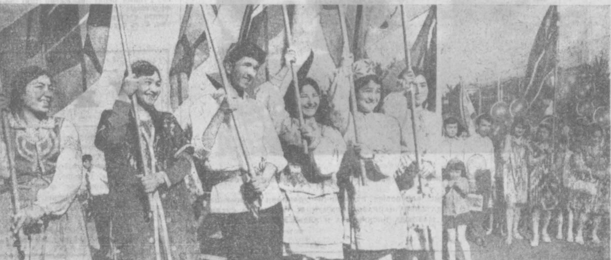
НА СНИМКАХ: ПЕРВОМАЙСКАЯ ДЕМОНСТРАЦИЯ ТРУДЯЩИХСЯ ГОРОДА — НА ПЛОЩАДИ ИМЕНИ В. И. ЛЕНИНА.