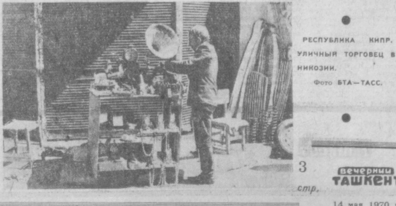
РЕСПУБЛИКА КИПР, УЛИЧНЫЙ ТОРГОВЕЦ В НИКОЗИИ.

ТОКИО. Министерство почт и телеграфа Японии решило выпустить новую серию марок, посвященную Всемирной выставке «ЭКСПО-70». Новая серия состоит из трех марок. На одной из них панорама выставки на фоне земного шара, на второй — праздничное шествие с фанерами по территории выставки. На третьей помещена репродукция с картины японского художника Санака «Пейзаж с осенними и летними травами».