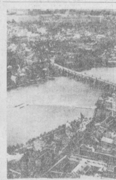
ЧССР. Прага. Вид на реку Влтаву и Карлов мост.

крестьяне и сельскохозяйственные рабочие. Его победители выступят в специальной программе по Гаванскому телевидению. В канун Первой мая на Кубе по традиции были подведены итоги десятилетия социалистического строительства. В нынешнем году оно проходило под знаком 100-летия со дня рождения В. И. Ленина. Особо отличившиеся передовики труда награждены специальными грамотами — «Награда к 100-летию Ленина».