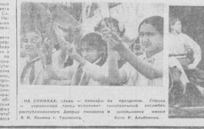
НА СНИМКАХ: слева — пионеры на празднике. Справа — украинский танец исполняет танцевальный ансамбль республиканского Дворца пионеров и школьников имени В. И. Ленина г. Ташкента.

рой половине 1970 года. А в середине года собралась третья областная и третья городская конференция ташкентских областного и городского обществ охраны природы, которые подведут итоги работы этих обществ за истекшие четыре года.