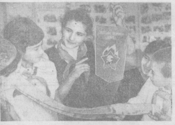
За активное участие в пионерской экспедиции «Заветам Ленина верны» пионерская организация Октябрьского района города Ташкента награждена вымпелом и лентой Всесоюзной пионерской организации имени В. И. Ленина. НА СНИМКЕ: пионеры рассматривают вымпел и ленту к знаменю.