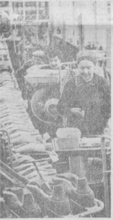
Четыреста пар модельной дамской обуви в день выпускает новая поточная линия обувной фабрики № 2. На снимке: новая поточная линия.

в Узбекский научно-исследовательский институт животноводства поступила радостная весть: совхоз «Ахангаран» № 4 вы-