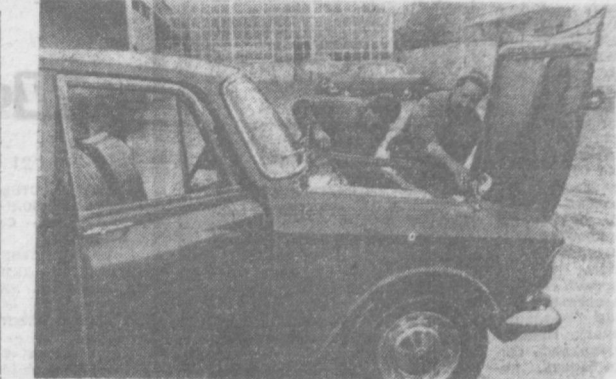
ТЕГЕРАН. На улицах иранской столицы часто можно видеть советские автомобили «Волга» и «Москвич». Своей выносливостью, хорошей проходностью и надежностью машины завоевали в стране добрую славу. В Тегеране имеется ряд станций технического осмотра иранской компании «Ираншарк» по импорту и обслуживанию советских автомобилей.

Бывают времена, когда даже через сотни, через тысячи километров, презрев бескрайние просторы земли, наш слух отчетливо воспринимает тревожное бие сердце человеческих в далеких-далеких странах. И боль, поразившая эти сердца, мы переживаем, как собственную. Руки тогда сжимаются в кулаки. И гнев и обиды народа далекой страны будоражат наше сознание, зовут к действию.