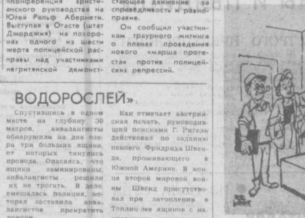
У АМЕРИКАНСКОГО БОССА. Делегация рабочих: «Хорошо, мы не будем больше требовать сокращения рабочей недели. А как насчет увеличения выходных?» Карикатура из американской газеты «Дейли уорлд».

НЬЮ-ЙОРК. Напряженное положение сохраняется на границе Гондураса с Сальвадором. Как сообщает корреспондент агентства Ассошиэйтед Пресс из Сальвадора, согласно официальному комюнике сальвадорских властей, 11 гондурасских солдат были убиты в минувшее воскресенье во время нападения двух армейских подразделений Гондураса на населенные пункты Сальвадора в департаменте Чалатенанго. Новые пограничные инциденты произошли всего неделю спустя после подписания соглашения между Гондурасом и Сальвадором, которое должно было положить конец непрекращающимся с июля прошлого года вооруженным конфликтам.