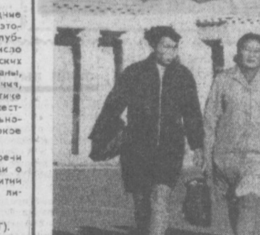
Каждый пятый человек в МНР обучается в каком-либо учебном заведении. НА СНИМКЕ: студенты Государственного улан-баторского педагогического института.