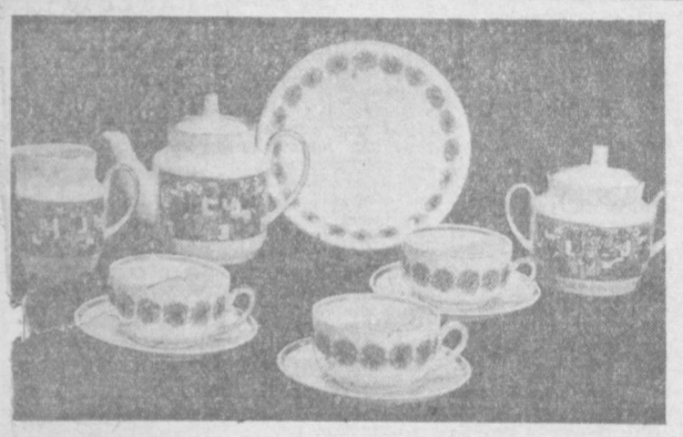
В художественной лаборатории Рижского фарфорового завода разработаны новые формы и рисунки посуды. На заводе идет выпуск новой продукции. Это чайный сервиз «Рига», кофейный сервиз «Салютет»... НА СНИМКЕ: чайный сервиз «Рига» (форма — Л. Агаджанян, рисунок — М. Генер).