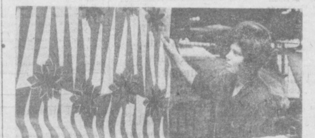
ЛЕНИНГРАД. Красивы ткани, выпускаемые коллективом ситцеабаевой фабрики имени Веры Слуцкой. В этом году два вида тканей удостоены государственного Знака качества.

Море... Ташкентцы не избалованы большой водой. Водная гладь озер в парках имени Ленинского комсомола и Победа невелика, загородный парк «Рахат» еще недостаточно обжит. Ташкентское море не сравнится с одним из этих озер: площадь зеркала водохранилища превышает двадцать квадратных километров. А вода! В ветреную погоду здесь гуляют настоящие морские волны с белыми гребешками пены. И чайки прижились здесь. Пляжи парка тянутся на два километра. За ними — густые тополиные рощи, посаженные мелководными Среднеазиатского лесхоза. Вода, сама по себе, необходима для полноценного отдыха. Но лес и вода — это уже оздоровительный комплекс. В таких местах, на лоне природы, незаметно пролетает день, и многие семьи приезжают сюда на два выходных дня, ночуя в палатках или спальных мешках прямо на берегу теплых лагун. И сожалею, парк еще не располагает пансионатом с благоустроенным ночлегом, хотя место для него отведено. Но летнюю ночь приятно споротать и в нехитрых походных условиях. Зато можно утром по свежей росе услышать соловья. Встретить восход солнца! на востоне кто-то зажигает костер, поджидывая в него все больше и больше дров. Потом вслед