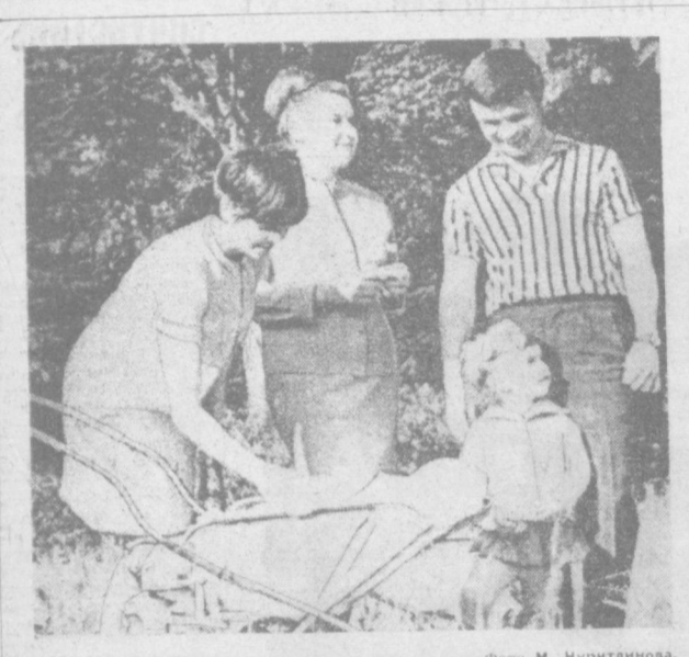
В паре Победа.