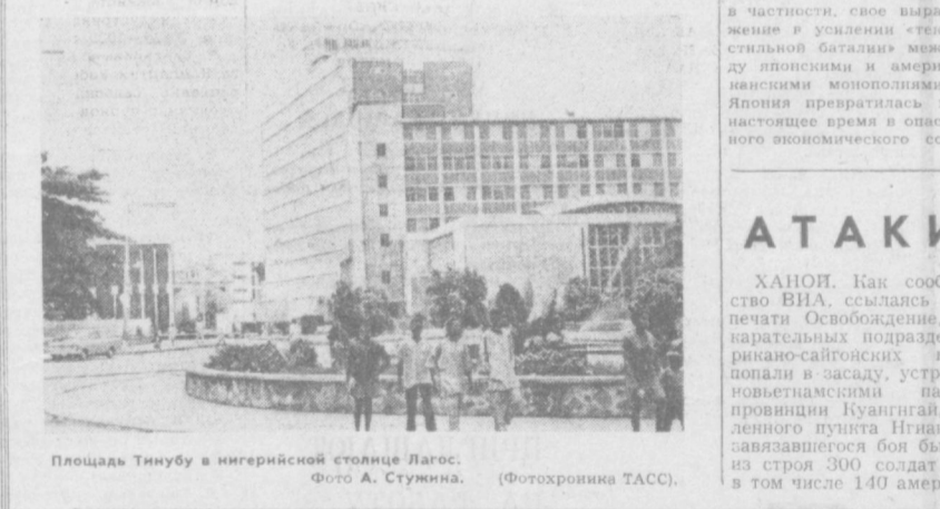
Площадь Тинубу в нигерийской столице Лагос.

ПОХИЩЕННОЕ ОРУЖИЕ ОБНАРУЖЕНО НИКОЗИЯ. В опубликованном здесь сообщении правительства говорится, что кипрская полиция обнаружила в пяти километрах от Лимасолы оружие, которое 10 мая было выхвачено из лимасольского округа полицейского управления. В связи с хищением, сообщает газета «Филэтерос», суды Никозии и Лимасолы вынесли решение о предельном заключении 41 человека с целью проведения расследования. Среди арестованных восемь полицейских, один сержант полиции и два сержанта национальной гвардии.