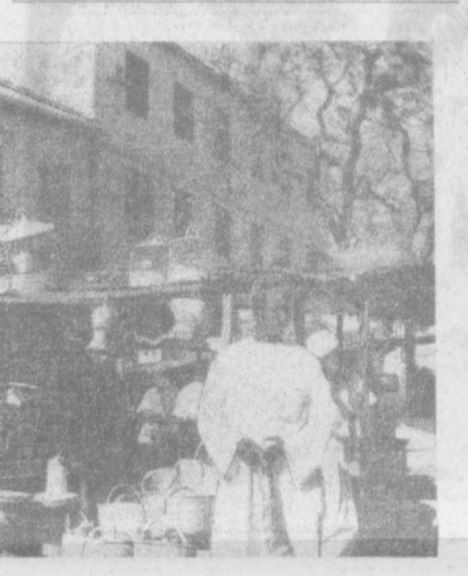
ДАКАР. На базаре сенегальской столицы.

ВСТРЕЧА ПРЕДСТАВИТЕЛЕЙ ЧЕТЫРЕХ ДЕРЖАВ НЬЮ-ЙОРК. Здесь состоялась очередная встреча представителей СССР, США, Англии и Франции по вопросам