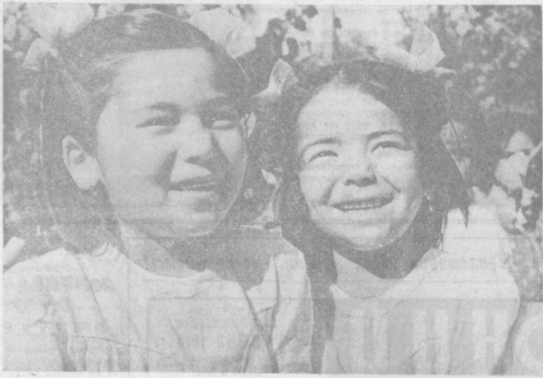
Вырастай, на земле все во имя тебя, человек!

На слете ребята встретятся со известными людьми Узбекистана, Героями Советского Союза, Героями Социалистического Труда, первыми пионерами республики.