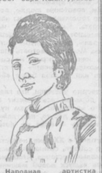
Народная артистка СССР Сара Ишанбаева.