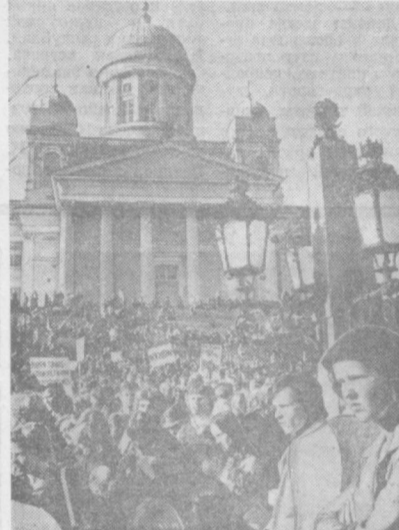
ХЕЛЬСИНКИ. Демонстрация протеста финской молодежи против вторжения американских войск в Камбоджу. Участники манифестации потребовали немедленного прекращения агрессивных действий США в Юго-Восточной Азии. Плакаты гласят: «США — вои из Вьетнама!», «США убивают во Вьетнаме и Камбодже!», «Финляндия должна признать Вьетнам!», «США — вои из Лас-Са!».

ПРАГА. На турбинном заводе машиностроительного комбината в Брно закончены испытания четвертой в нынешнем году турбины типа «Ладосга». Она предназначена для Советского Союза. В соответствии с соглашением в ближайшее время несколько лет чехословацкие машиностроители поставят в СССР 90 таких турбин. Они будут использоваться на вновь строящихся советских магистральных газопроводах.