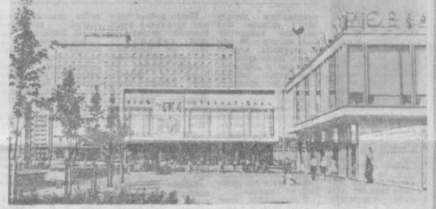
БЕРЛИН СЕГОДНЯ. Гостиница «Берлина», кинотеатр «Интернациональ» и ресторан «Москва» на Карл-Маркс-Аллее.