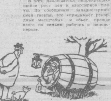
Вы философ? Нет, слишком дорого платить за жилье! Карикатура из журнала «Квик» (ФРГ).