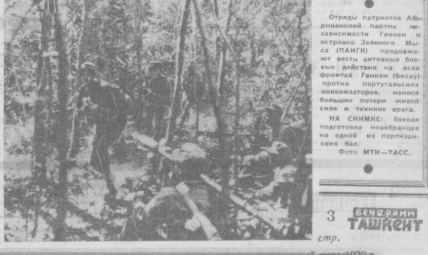
Отряды патриотов Африканской партии независимости Гвинеи и островов Зеленого Мыса (ПАИГО) продавливают вестив античные боевые действия на всех фронтах Гвинеи (Бисау) против португальских колонизаторов, наносит большие потери живой силе и технике врага. НА СНИМКЕ: боевая подготовка новобранцев на одной из партизанских баз.

ЯПОНСКИЕ бизнесмены предлагают, что если США не примут мер для ограничения ввоза японских товаров, их торговый дефицит с Японией уже к концу нынешнего года достигнет 1,3 млрд. долларов. В качестве первой меры Вашингтон ограничил импорт японских текстильных изделий из шерсти и искусственно-волокна. Ввоз этих товаров по демпинговому ценам привел и разорению десятков американских текстильных предприятий и увольнению около 250 тысяч рабочих. Накал конкурентной борьбы японских и американских промышленников достиг небывалого ожесточения. Недаром журналисты называют ее «текстильной войной». Вопрос этой войны решается на правительственном уровне. Министр внешней торговли и промышленности К. Минэгава на встрече с ведущими предпринимателями своей страны заявил: до тех пор, пока Япония не заключит с США соглашения о сокращении экспорта изделий из шерсти и искусственно-волокна, США будут вынуждены мириться с созданным ее положением. Японская сторона все чаще прибегает к тактике затягивания переговоров. Вашингтон, в свою очередь, усиливает на-