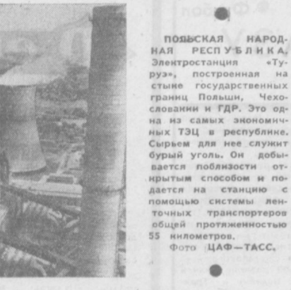
ПОЛЬСКАЯ НАРОДНАЯ РЕСПУБЛИКА. Электростанция «Турзу», построенная на стыке государственных границ Польши, Чехословакии и ГДР. Это одна из самых экономичных ТЭЦ в республике. Сырьем для нее служит бурый уголь. Он добывается близостью открытым способом и подается на станцию с помощью системы ленточных транспортеров общей протяженностью 55 километров.