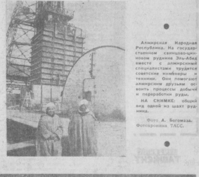
Алжирская Народная Республика. На государственном свинцово-цинковом руднике Эль-Абел вместе с алжирскими специалистами трудятся советские инженеры и техники. Они помогают алжирским друзьям освоить процессы добычи и переработки руды. НА СНИМКЕ: общий вид одной из шахт рудника.

Год назад в Москве состоялась международное Совещание коммунистических и рабочих партий. Газеты публикуют статью «Программа борьбы и единства — в действии», посвященную первой годовщине Совещания. В связи с 25-летием со дня образования Общества венгеро-советской дружбы, посвященную первому годовщине Совещания.