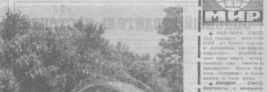
В ПАРКЕ ИМЕНИ ЛЕНИНСКОГО КОМСОМОЛА.