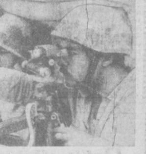
ОАР. Египетский народ полон решимости защищать свою страну, обуздать израильских захватчиков.

НА СНИМКЕ: бойцы одной из пехотных частей во время военных маневров.