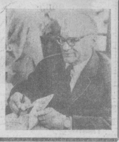
Традиционные майские книжные ярмарки прошли во многих городах Польской Народной Республики. В Варшаве, за прилавками, выставленными на открытом воздухе, рядов с продавцами стояли известные писатели и поэты. Книголюбам могли тут же получить автограф авторов произведений. НА СНИМКЕ: известный польский писатель, лауреат международной Ленинской премии Ярослав Ивашевский подписывает свою книгу у одного из ларьков.

ют уже 7 советских буровых установок. ХАНОЙ. (ТАСС). Как сообщает агентство ВНА со ссылкой на агентство Кабсан Патет-Диа, патристические силы Лаоса в ночь на 9 июня овладели провинциальным центром Сараван (Южный Лаос). В бою было выведено из строя более 500 солдат и офицеров противника, обито два американских самолета и захвачено большое количество оружия и военного снаряжения.