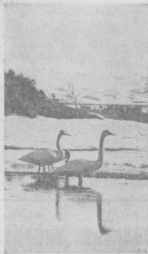
Камчатская область. Незамерзающее озеро в Елизаровском районе — место зимовки лебедей-кликунов.

Фоторепортажи должны сопровождаться пояснительными текстами. Снимки присылают по адресу: Ташкент, ГСП, проспект Ленина, 41. Работы, присланные на фотоконкурс, не возвращаются и не возвращаются. Последний срок отправки снимков на конкурс — 30 ноября с. г. Творческих успехов вам, мастера объектива!