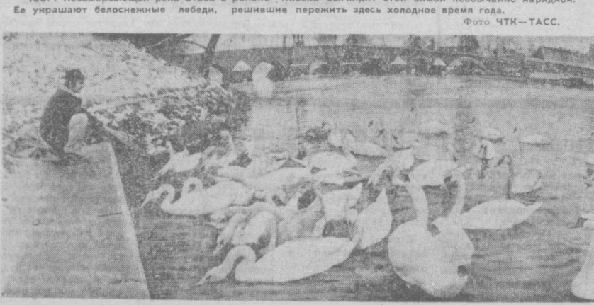
СССР. Незамёрзшая река Отава в районе Писка выглядит этой зимой необычайно нарядной. Ее украшают белоснежные лебеди, решившие пережить здесь холодное время года. Фото ЧТК—ТАСС.

поможет заводчанам сэкономить 7,4 тысячи рублей в год. Ведь режущий инструмент — очень «ходовой» в производстве. Он используется почти на всех участках, там, где есть токарные, сверлильные и прочие станки. Бесомы вклад в развитие производства внесли и специалисты Среднеазиатского научно-исследовательского института по ирригации (САНИИРИ). Они разработали технологию изготовления экскаваторов с усовершенствованным лезвием. Благодаря замковой подвеске в процессе эксплуатации машины на землеройных работах значительно возрастает производительность труда. Завод уже выпустил пять таких опытных образцов. Они проходят испытания в Ташкенте и в Сырдарьинской области. Уже поступили лестные отзывы о их высоких эксплуатационных качествах. Большой эффект принесли контакты и с Государственным специальным конструкторским бюро по ирригации. Совместно со специалистами ГСКБ коллектив завода освоил производство сердечников для труб с железобетонным покрытием. 16 километров таких труб направлено на строительство ирригационно-мелиоративных сооружений. Осенью прошлого года специалисты завода и ГСКБ по ирригации побывали в Сурхандарьинской области — там проходили испытания дренажных машин, которые начал выпускать ремонтно-эксплуатационный завод. Испытания прошли успешно. Впереди — серийное производство. Только в 1977-78 годах завод выпустил около 50 комплектов дренажных машин. И. ГОНОШИЛЛА.