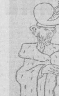
Der Zar bei Gorki

Охранка же задумала представить шестине рабочих к Зимнему дворцу как результат деятельности революционного комитета, во главе которого якобы находился М. Горький. Вот почему она поспешила расправиться с писателями и другими членами делегации. У них были проведены обыски. Впрочем, они не дали жандармам никаких документов, которые могли бы хоть сколько-нибудь доказать существование революционного комитета.