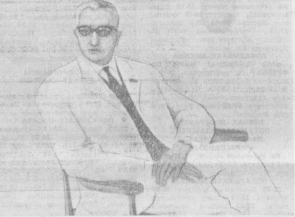
Р. Чарьев. «Портрет народного артиста СССР Алина Ходжаева».

узбекских художников. Москвичи знакомятся с творчеством народных художников Узбекистана: Р. Ахмедова, К. Черракова, Ч. Ахмарова. Кисти Б. Бабаева принадлежат триптих «Ферганская сюита». Несколько аквареллистов избрали своей темой непосредственно родной город. Серия А. Котлова так и называется — «Новостройки Ташкента». А среди работ К. Черракова выделяется акварель «Музей Ленина».