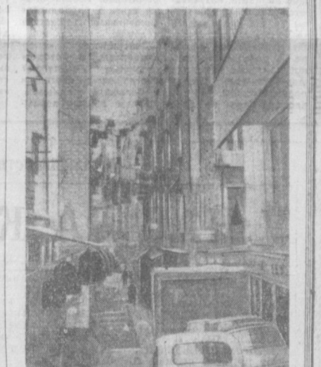
ИТАЛИЯ. Переулки Неаполя.

КОНАКРИ. Здесь состоялся первый концерт советских артистов, совершивших турне по странам Западной Африки. В составе труппы грузинский вокально-инструментальный ансамбль «Дизел», артисты Московской государственной эстрады. Концерт прошел с большим успехом. Газета «Унита» отмечает высокое исполнительское мастерство советских артистов. «Мессаджеро» подчеркивает, что трои апплодисментов не смогла в течение всего спектакля. РИМ. На сцене римского оперного театра выступил мастер советского балета Екатерина Максимова и Владимир Васильев. Они исполнили партии Жизель и принца Альберта в балете Адольфа Адана «Жизель». Газета «Унита» отмечает высокое исполнительское мастерство советских артистов. «Мессаджеро» подчеркивает, что трои апплодисментов не смогла в течение всего спектакля.