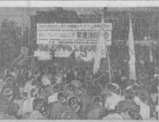
Недавно в Японии прошли массовые демонстрации и митинги протеста против агрессии США в Индонезии. Демонстранты требовали немедленного прекращения войны в Юго-Восточной Азии и вывода американских войск из этого района мира. НА СНИМКЕ: митинг протеста в Токио. На лозунге надпись: «Против агрессии США в Камбодже и расширения войны в Индонезии».

ДАР-ЭСС-САЛ А М. Расистские власти ЮАР завершили создание еще одного «самостоятельного бантустана» — Зулуленда. Судя по сообщениям из Йоханнесбурга, администрация в этом центре Зулуленда, эмиссары Претории уже «укомплектовали» местную администрацию из числа угодных им представителей племенной верхушки. Как и в Транскее, первом из так называемых «самоуправляющихся бантустанов» ЮАР, в Зулуленде местные власти будут пользоваться весьма ограниченными правами, а вся власть будет фактически сосредоточена в руках «белого администратора». Любое решение местной администрации, пришедшее не по душе правителям Претории, может быть немедленно отменено. Как известно, зулусы вписали не одну страницу в историю героической борьбы африканцев с колонизаторами. На протяжении последних лет они упорно отвер-