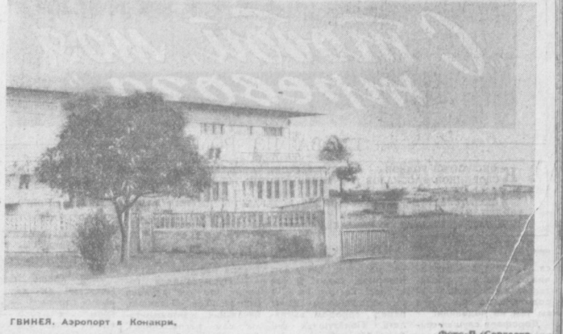
ГВИНЕЯ. Аэропорт в Конакри.