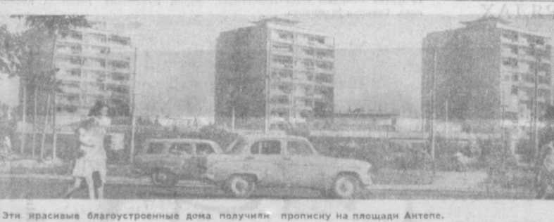
Эти красивые благоустроенные дома получили прописку на площади Антена.