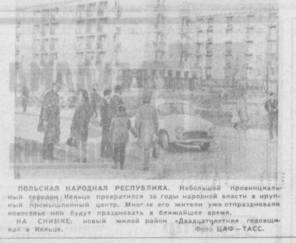
ПОЛЬСКАЯ НАРОДНАЯ РЕСПУБЛИКА. Небольшой провинциальный городок Кельце превратился за годы народной власти в крупный промышленный центр. Многие его жители уже отпраздновали новоселье или будут праздновать в ближайшее время. НА СНИМКЕ: новый жилой район «Двадцатилетия годовщины» в Кельце. Фото ЦАФ — ТАСС.

ПРАГА. Строители административного центра Северочешской области города Усти-на-Лабе начали возводить на северной окраине города новый жилой массив, крупнейший в городе. По плану до 1974 года здесь вырастут жилые дома на 1.200 квартир, три школы, гостиница на 300 мест, здание обществено-культурного центра, кинотеатр, магазин. Характерная черта нового района — новейшее оборудование квартир, современная планировка кварталов, продуманная и научно-обоснованная система транспортных магистралей.