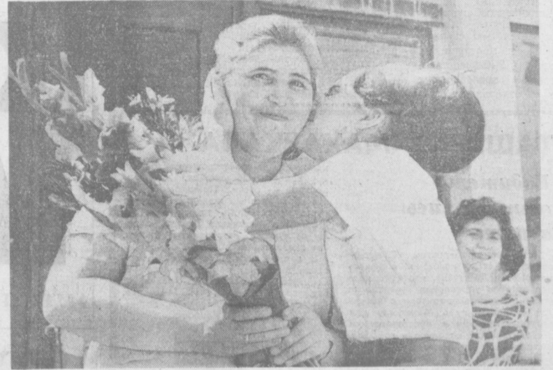
Учительница перала мол...

Р. КОСЫХ, заместитель заведующего горно-