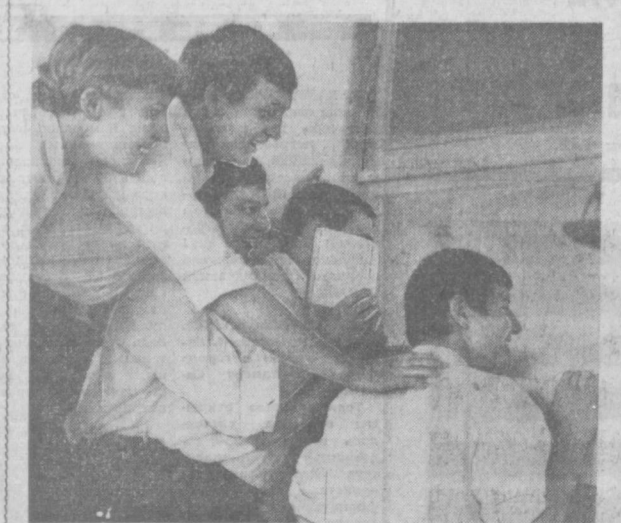
Идеи экзамен. Больельщики...

В ТЭС уделяется большое внимание организации подготовительных курсов. Ес-