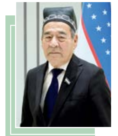
Ўқтам ОХУНОВ, сенатор

Ушбу дўстлик абадий бўлсин! Ришталаримиз янада мустақам, келажакимиз янада нурафшон бўлсин!