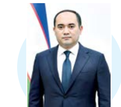
Шохруҳ ДАЛИЕВ, олий таълим, фан ва инновациялар вазирининг биринчи ўринбосари

Марказий Осие бой тарихий, маданий ва иқтисодий мероси билан танилган, шунингдек, бугунги кунда глобаллашув ва модернизация жараёнларига замонавий қадамлар билан қўшилаётган минтақадир. Минтақадаги мамлакатлар — Ўзбекистон, Қозоғистон, Қирғизистон ва Туркменистоннинг интеграция ва ўзаро ҳамкорлик йўлидаги кучи беқарор кечаётган дунёда жиддий аҳамиятга эга. Ўз навбатида, мазкур давлатлар раҳбарларининг ҳар бири ўз мамлакатининг ижтимоий ва иқтисодий тараққиётини ушбу ҳамкорлик орқали ривожлантиришга қатъий тайёр эканини намойён этмоқда.