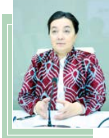
Зулайҳо МАҲКАМОВА, Бош вазир ўринбосари — Оила ва хотин-қизлар кўмитаси раиси

Учинчи асосий жиҳати — янги инфратузилма ва транспорт алоқаларини ривожлантиришга келишилди. Жумладан, томонлар авиакатнов ва автобус йўналишларини кенгайтириш,