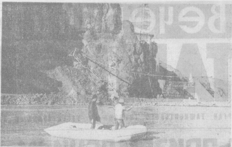
На юге Марокко с помощью Советского Союза сооружается гидротехнический комплекс Нурба, имеющий важное народнохозяйственное значение. Водохранилище объемом в пятьсот миллионов кубических метров воды позволит создать систему искусственного орошения на площади 15 тысяч гектаров засушливых земель. Сейчас строительство идет полным ходом. Увеличивается основное русло реки Дра, работает бетонный завод, действуют гранично-сортировочные установки.

НА СНИМКЕ: временная переправа через реку Дра.