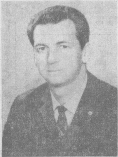
В. И. СЕВАСТЬЯНОВ.