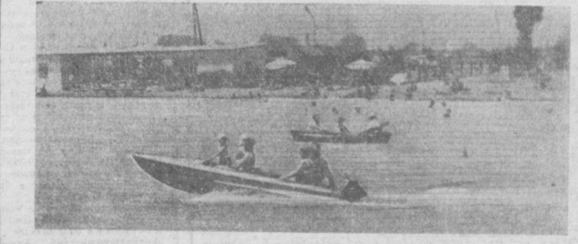
ОЗЕРО «РОХАТ». ГОРОЖАНА НА ОТДЫХЕ.

Третья группа уехала в гости трудовой отпуску в совхоз «Мичурин» на Сырдарье. Здесь есть палатки, комнаты, водохранилища, лодки — словом, все для хорошего отдыха. Первая группа уже завершает свой отпуск. Это мастер Ю. Лукьянов, рабочий А. Зонов и другие.