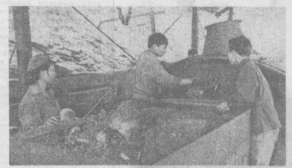
ДРВ. Горняки угольного бассейна Хонгай борются за увеличение добычи угля. Большую помощь в этом им оказывают советские специалисты. Они помогают вытеснять старые, осваивать новую горную технику, восстанавливать шахты.

производство свыше 3.000 новых типов машин, оборудованных и технологических установок. Среди них — нефтяные буровые установки для бурения скважин глубиной 7.000 м, автоматические станки, тракторы, электровозы, легкие автомобили и турбоагрегаты.