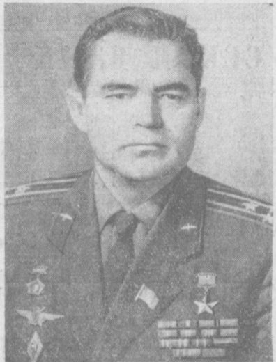
А. Г. НИКОЛАЕВ.

ВЧЕРА, УСПЕШНО ВЫПОЛНИВ ПРОГРАММУ ДЛИТЕЛЬНОГО ПОЛЕТА ПО ОКОЛОЗЕМНОЙ ОРБИТЕ, КОСМИЧЕСКИЙ КОРАБЛЬ «СОЮЗ-9» ПРИЗЕМЛИЛСЯ В ЗАДАННОМ РАЙОНЕ ТЕРРИТОРИИ СОВЕТСКОГО СОЮЗА КОСМОНАВТЫ ТОВАРИЩИ А. Г. НИКОЛАЕВ И В. И. СЕВАСТЬЯНОВ ЧУВСТВУЮТ СЕБЯ ХОРОШО.