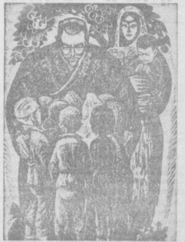
Картинная галерея «Вечерний». А. Цицилинцев «Мой дом — ваш дом».

По подсчету первооткрывателя этой своеобразной «картинной галереи», — учителя из Навои Бориса Степановича Калатовина, таких рисунков в Сармыше насчитывается несколько тысяч.