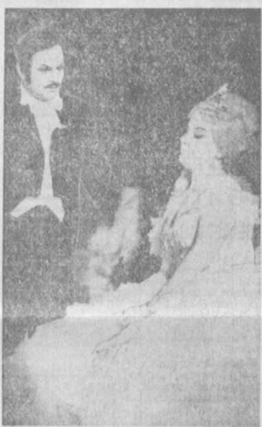
В Ташкенте продолжают гастроли Оренбургского театра оперетты. Наши гости показали оперетту И. Штрауса «Король вальса».

Зари вечерней Флаг багряно-броский Взметнулся ввысь И отсветы красны. Смотрите, рядом Навои и Маяковский — На деревянной полке у стены. Один — Хусейна Байкары ровесник, Другой — рабочей гвардии певец, И оба — Гордые пророки песни, И каждый — справедливости борец, И на одном поэзии мосту Стоят они Навсич на посту. — О, Маяковский, мавляна! — скажу я. Воскликну я: Товарищ Навои! Пяти столетий прах, добра возмужа, Лежит меж вас, наставники мои. Разбиты шахов золотые троны, Распалась пень... Как мужества пример, В Москве, Тверским бульваром, вдоль газона В чашке из облака проходит Алишер. Вот площадь Пушкина, тут всенародный праздник Поэзии, мечты и мастерства. Хороших сколько тут певцов и поэтов, Как сталь клинков, сплываются слова. Поэзия — не годы и не тоны, А блеск клинка, и свист его, и боль — Из века в век... И те ее достойны, На чьих губах след человеческой соль, Кто, как народа руки, в каждом деле, Кто, как народа голос, мудрый, смелый, Кто служит честно своему народу, Всей кровью песни — своему народу! Идет из века в век В стихе мгновенном вечный человек. И потому мгновенны стихи Идут, как постижения веков, Шатают Навои и Маяковский Плечом к плечу из края в край земли. Зари весенней флаг багряно-броский Взметнулся ввысь, и догнел вдали. Перевела с узбекского С. Сонова.