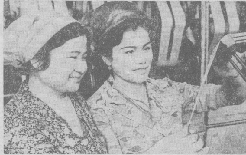
Каждый день все больше последователей. Новый стимул этому движению, подчеркивалось на митинге, придает Письмо ЦК КПСС, Совета Министров СССР, ВЦСПС и ЦК ВЛКСМ о разветвлении социалистического соревнования. Сейчас на повышенном уровне трудятся 1.112 мастерских предприятия.

Снизить себестоимость строительно-монтажных работ на 0,1 процента. Повысить производительность труда на 0,2 процента против утвержденных плановых показателей и дополнительно выполнить строительно-монтажных работ на 50 тысяч рублей.