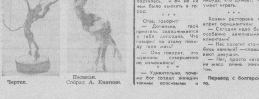
Чертик. Пеликан. Собрал А. Князкин.