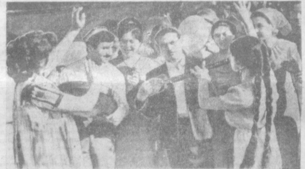
В парке имени Пушкина.

парк имени Ленинского комсомола заполнят студенты. Здесь состоится большой вечер, посвященный 50-летию со дня подписания В. И. Ленинским декрета об основании Ташкентского государственного университета. Л. ДУБРОВСКАЯ.