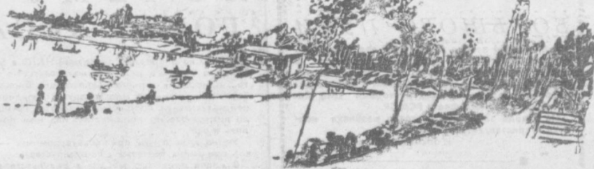
Парк имени 40-летия комсомола Узбекистана. На пляже.

Завтра летняя эстрада приглашает желающих принять участие в киновечере «По родной стране».