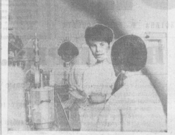
ГДР. В республике созданы новые легко усваиваемые сорта хлеба и пищевые продукты, богатые витаминами и белками. Большая заслуга в данной области принадлежит сотрудникам института переработки зерна в Рэбрюне близ Потсдама. Здесь же разрабатывается современная технология производства. Институт поддерживает тесные деловые связи с родственными научно-исследовательскими учреждениями 25 стран мира. НА СНИМКЕ: работники института определяют качество муки и крахмала.

Б УХАРЕСТ. На известном румынском курорте Мамай проходит традиционный международный фестиваль мультфильмов. В нем участвовало 26 киностудий из 26 стран, в том числе из Советского Союза.