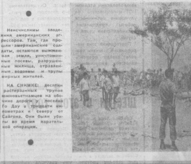
НА СНИМКЕ: десант разбросанных трупов южновьетнамцев в обочине дороги у поселка Го Дау в тридцати километрах к северу от Сайгона. Они были убиты во время карательной операции.