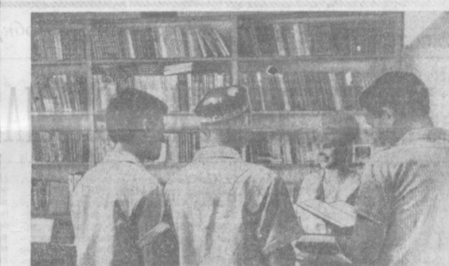
В 9-этажном доме по улице — Ленина на днях открыт магазин «Ама, дамкина». НА СНИМКЕ: в одном из отделов магазина.

«Тревожная зима 1942 года. По волжской степи движется зловещее танковое колыбельное Манштейна. Они рвутся к Сталинграду на выручку окруженным войскам Павлова. Железной стеной встает на их пути... Этому событию, происходившему в течение суток и описанному в повести известного советского писателя Юрия Бондарева «Горячий снег», посвящается читательская конференция, которая пройдет в зале ОДО. Ее участники — молодые офицеры Советской Армии,