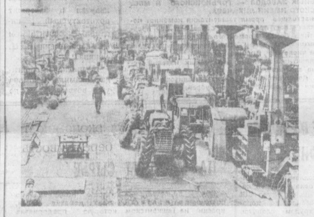
Будапештский завод «Красная Звезда» — широко известное предприятие народной Венгрии. Изготавливаемые здесь тракторы работают на полях многих стран.

У ЛАН-БАТОР. В монгольском государственном университете им. Чойбалсана — кузнице квалифицированных кадров для народного хозяйства МНР — состоялся очередной 25-й выпуск молодых монгольских специалистов. Более 650 юношам и девушкам в торжественной обстановке были вручены дипломы об окончании университета. Среди них много инженеров-строителей, энергетиков, геологов, экономистов. Монгольский государственный университет был создан в 1942 году с помощью Советского Союза. В то время в университете было всего лишь три факультета — педагогический, медицинский и зооветеринарный. В 1946 году состоялся первый выпуск университета — его окончил 46 человек. Сейчас на 11 факультетах университета обучается около 3.000 монгольских юношей и девушек.