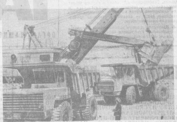
В СИРИЙСКОЙ АРАБСКОЙ РЕСПУБЛИКЕ на реке Евфрат при технической помощи Советского Союза сооружается гидроэлектростанция Т444 мощностью 400 тысяч киловатт. Намынная плотина высотой 60 метров и длиной 2,5 км образует водохранилище емкостью 12 миллиардов кубических метров воды, что позволит оросить 600 тысяч га засушливых, но плодородных земель.

В АНР. В Объединенной Арабской Республике полностью завершены работы по сооружению линий электропередач в 300, 220 и 132 киловольт, которые связывают гидроэлектростанцию высокой Асуанской плотины с Нижним Египтом, а также соответствующих подстанций. Все объекты сданы в постоянную эксплуатацию и работают устойчиво. Подходят к концу и другие работы по созданию Асуанского гидроэнергетического комплекса. 27 июня была сдана в эксплуатацию 11-я турбина гидроэлектростанции. Заключается монтаж 12-го, последнего агрегата. Это дает твердую уверенность в том, что все основные работы по Асуанскому гидроэнергетическому комплексу в целом будут завершены в июле 1970 года, то есть значительно ранее, чем это было предусмотрено сроками, установленными межправительственным советско-египетским соглашением.