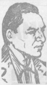
Малик КАЮМОВ, НАРОДНЫЙ АРТИСТ СССР.

ОТКРОВЕННО говоря, встречающаяся в печати и на телевизионном экране рубрика «Поговорим о кино» не вызывает у меня особого энтузиазма...»