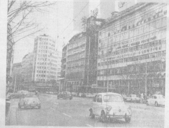
СФОРУ. НА УЛИЦЕ ТЕРАЗИЯ В БЕЛГРАДЕ.