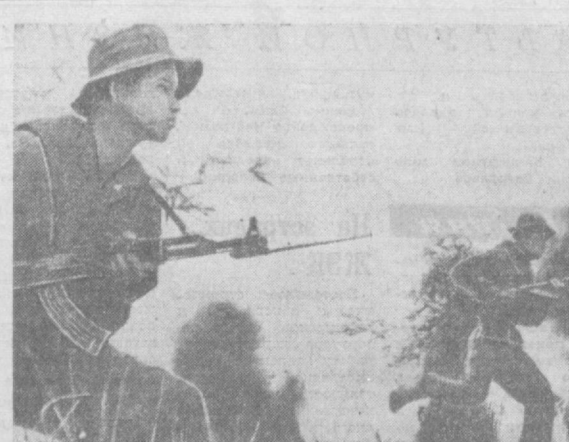
Юнонветнапские патриоты продолжают вести успешные бои против американско-сайгонских войск на всей территории Южного Вьетнама. НА СНИМКЕ: бойцы Народных вооруженных сил освобождения атакуют опорный пункт агрессоров.

ВРЕМЯ действия — с 9 часов утра до 3 часов дня. Место действия — город Кио, сфера, близ Токио. Небольшой буддийский храм. В храм идет служба — панихида, на которой присутствует более 600 гангстеров — представителей японских бандитских организаций, съехавших со всей страны. Автоматными пушками стреляют банды из соседних районов. В храме царит атмосфера хаоса. Две горючие бомбы, брошенные в храм, взорвались, вызвав пожар. Полиция пытается справиться с ситуацией, но гангстеры продолжают свои действия. В храме Комедзи в Токио произошло событие, которое потрясло японцев. В храме Комедзи, одном из самых священных мест Японии, произошла стрельба. Полиция пытается справиться с ситуацией, но гангстеры продолжают свои действия. В храме Комедзи в Токио произошло событие, которое потрясло японцев. В храме Комедзи, одном из самых священных мест Японии, произошла стрельба. Полиция пытается справиться с ситуацией, но гангстеры продолжают свои действия.