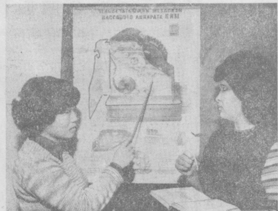
Ташхозкультторг. ТЕЛЕПРЕССАГЕНТСТВО «УЗОРГРЕКЛАМА».

Начало занятий — с 1 МАРТА; советуем поторопиться с подачей документов!