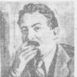
Таких запомнил Ю. Фучик ташкентцам.

Долго еще продолжалась беседа с этим удивительно интересным человеком, так много увидевшим в наших краях.