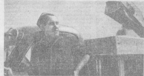
САМАРКАНДСКАЯ ОБЛАСТЬ. На обширных полях совхоза «Галларал» началась массовая жатва зерновых. Уборку ведут 70 комбайнов «СК-4». Совхоз нынче продает государству свыше 30 тысяч тонн пшеницы и ячменя.

Сейчас по дальним колхозам и совхозам автономной республики разъезжают 22 автоклуба.