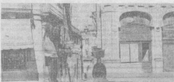
ИСПАНИЯ. Город Внго. НА СНИМКЕ: улочка на окраине города.

об этом, газета «Ультимас Нотнспас» пишет, что бандиты совершают убнйства крестьян по приказаниям крупных земельных собственников, которые стремятся захватить в свои руки как можно больше земель.