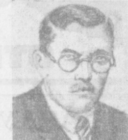
Ю. Фучик перед отъездом в СССР под видом доктора Мареша в 1934 году, когда был отдан приказ об его аресте.

Государственное издательство Узбекистана в 1960 году издало книгу «Юлиус Фучик о Средней Азии».