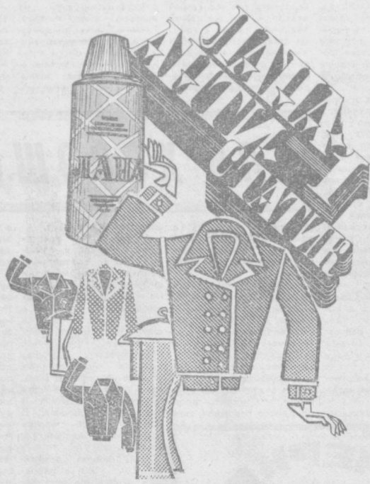
АЛМАЛЫКСКИЙ ЗАВОД БЫТОВОЙ ХИМИИ. ТЕЛЕПРЕССАГЕНТСТВО «УЗОРГРЕКЛАМА».

Купить их можно в хозяйственных отделах магазинов.