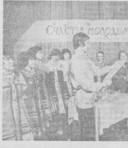
НА СНИМКЕ: зачитывается шуточный наказ жителей села Шунга молодоженам.